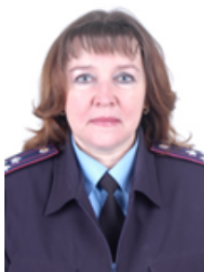
Петрова І.А. © доктор юридичних наук, професор