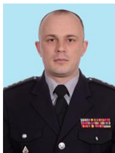
Дмитро ХУДЕНКО © начальник Департаменту кримінального аналізу (Національна поліція України, м. Київ, Україна)