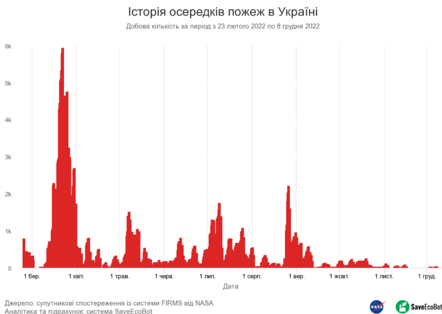
Рис. 3. Історія осередків пожеж в Україні протягом 24 лютого – 31 грудня 2022 року (за даними системи спостережень FIRMS) [7]

За даними SaveEcoBot, з початку повномасштабного вторгнення відбулись десятки тисяч пожеж на території України. У період найбільш активних бойових дій щодня реєстрували по декілька тисяч пожеж, а максимум зафіксували 22 березня – 5 957 активних пожеж наведено на рис. 3 [7].