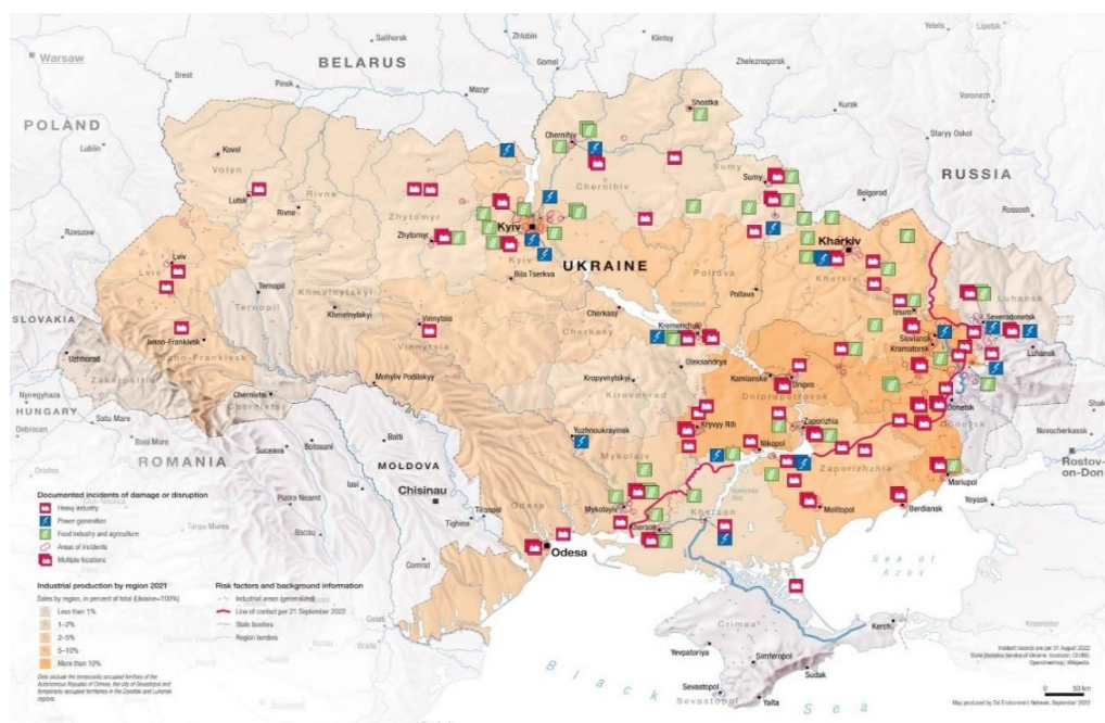
Рис. 2. Розташування та типи промислових об'єктів, пошкоджених або порушених конфліктом в Україні в період з лютого по серпень 2022 року [6]

Станом на кінець серпня зареєстровано понад 570 інцидентів на 250 промислових об'єктах України. Повідомляється, що приблизно 60 % цих інцидентів були результатом прямого фізичного ушкодження, які наведено на рис. 2 [6].